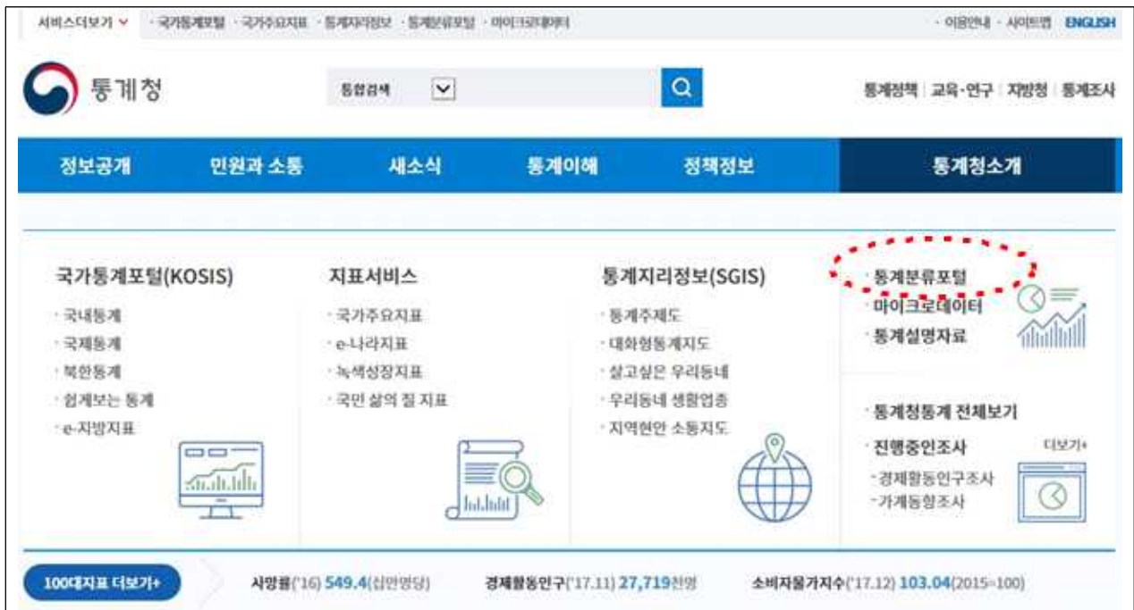
1. 통계청 홈페이지 접속 후 통계분류포털 클릭

[참고자료] 통계청 홈페이지 통계분류포털 접속 방법( http://kostat.go.kr )